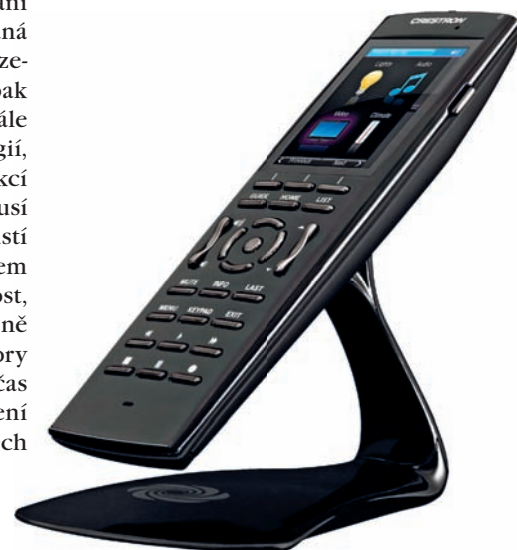
Crestron TPMC-3X je bezdrátový dálkový ovladač s 2,8" dotykovým displejem a Wi-Fi (cena 57 590 Kč).